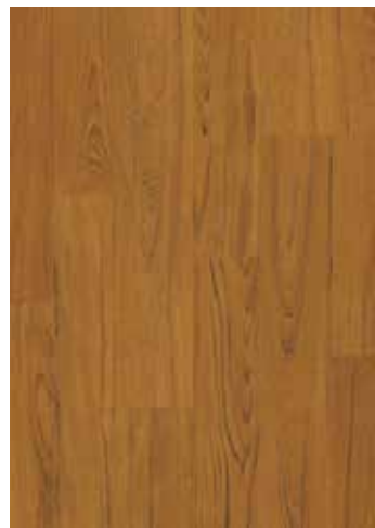
Teca Marrón Medio PIQ8-C010